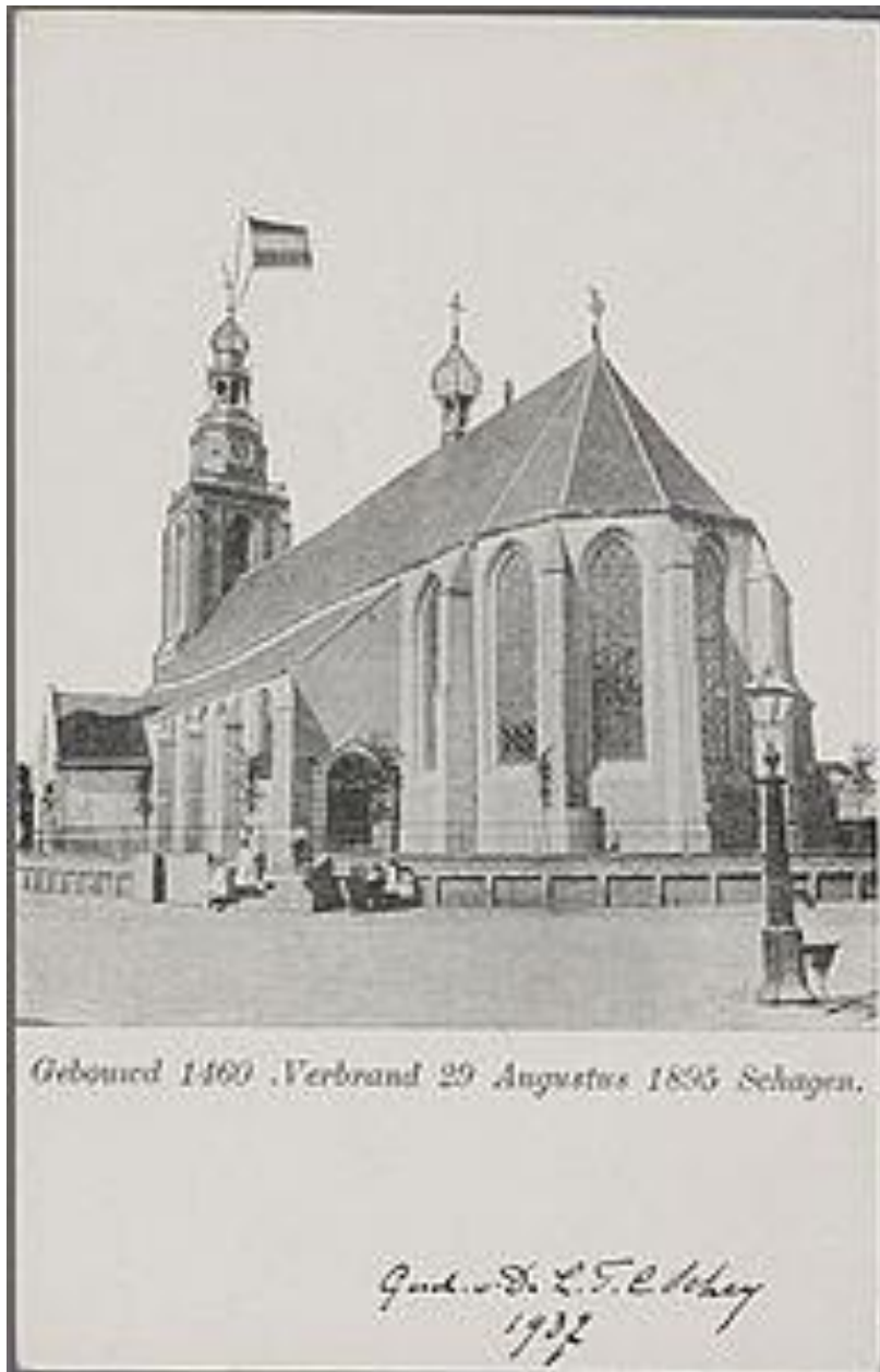
Schagen, kerk plm 1890

Tot in de negentiende eeuw is er infrastructuur gezien, nauwelijks iets veranderd aan de opzet van de bebouwing van Schagen. Aan de zuidzijde van de kerk stond het Schoutshuis, aan de oostelijke kerkhofsmuur stond het Raad/rechthuis en ten behoeve van de vismarkt werd aan de noordzijde van de kerk een stenen vishal neergezet, die rond 1800 is verdwenen. Op de oudste kadasterkaarten staat, nog aan de oude kerkhofsmuur vast gebouwd, een stenen gebouw dat waarschijnlijk dienst heeft gedaan als lijkenhuis, hoewel het daarvoor flinke afmetingen had. In het midden van de negentiende eeuw werd de oude kerkhofmuur afgebroken ten behoeve van de vergroting van het marktveld; hierbij werd ook een deel van de verhoging waarop de kerk stond, afgegraven. In 1896 werd de oude kerk vervangen door een nieuw gebouw.